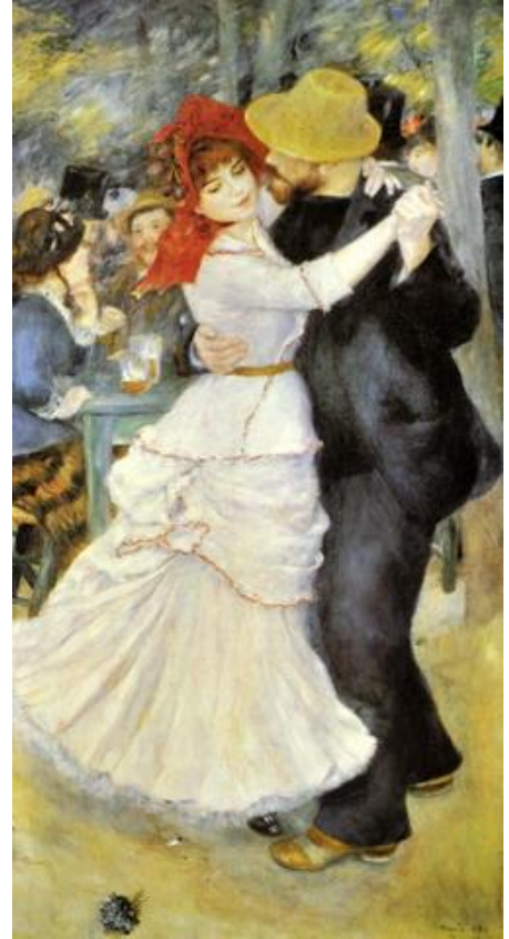
La Danse à Bougival (1882-1883) de P.-A. Renoir, Huile sur toile, 182 X 98cm, Museum of Fine Arts, Boston.